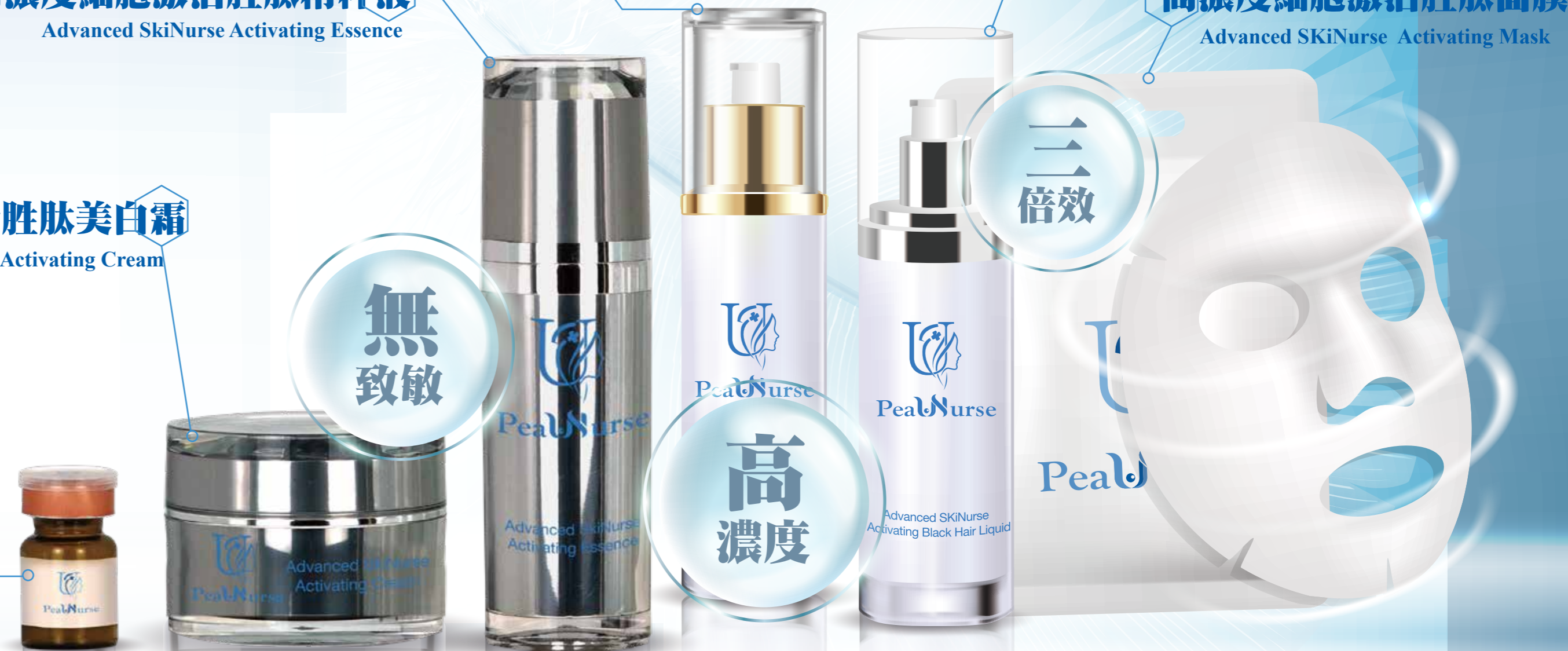
高濃度細胞激活胜肽面膜 Advanced SKiNurse Activating Mask